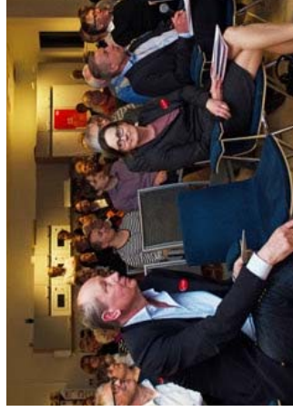
Årsstämma Västerås 23 april 2015

Årsstämma skall hållas senast fyra månader efter räkenskapsårets utgång. På årsstämman tas bl.a. beslut om godkännande av balans- och resultaträkningar, ansvarfrihet för styrelse och VD samt disposition av företagets balanserade vinstmedel.